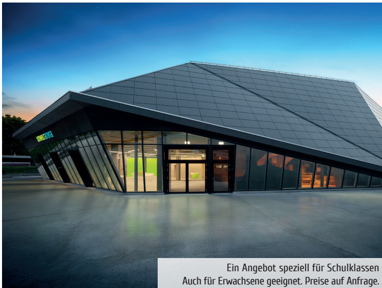
Ein Angebot speziell für Schulklassen Auch für Erwachsene geeignet. Preise auf Anfrage.