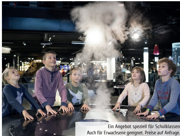
Ein Angebot speziell für Schulklassen Auch für Erwachsene geeignet. Preise auf Anfrage.