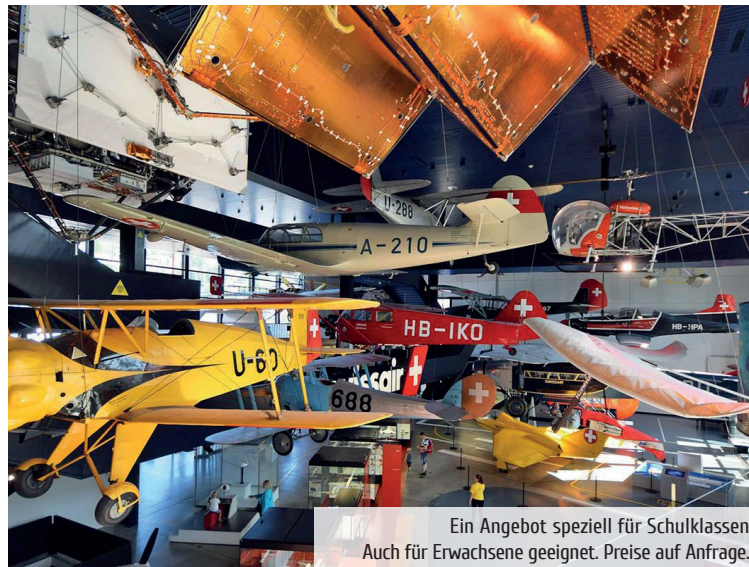
Ein Angebot speziell für Schulklassen Auch für Erwachsene geeignet. Preise auf Anfrage.