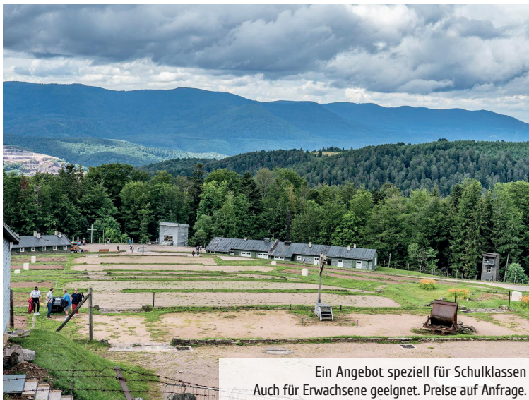
Ein Angebot speziell für Schulklassen Auch für Erwachsene geeignet. Preise auf Anfrage.